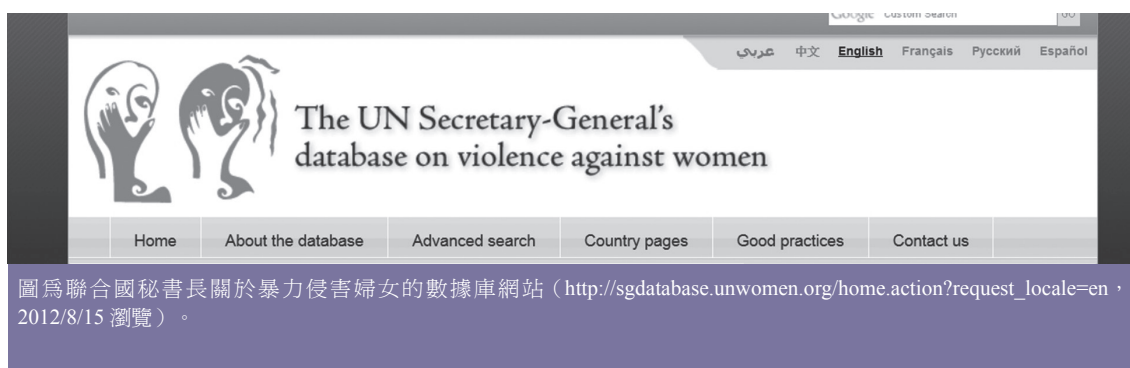
圖為聯合國秘書長關於暴力侵害婦女的數據庫網站（ http://sgdatabase.unwomen.org/home.action?request_locale=en ，2012/8/15 瀏覽）。

5. 全體和特定年齡的婦女在過去12個月遭受身體或性暴力的比率，包括由現任或前任的親密伴侶和發生頻率之分項統計（Total and age specific rate of ever-partnered women subjected to sexual and/or physical violence by current or former intimate partner in the last 12 months by frequency）