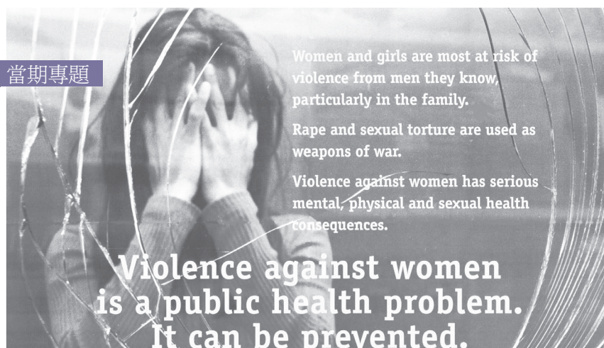
圖為世界衛生組織（World Health Organization）之宣傳海報（ http://www.who.int/gender/violence/posters/en/ ，2012/9/2 瀏覽）