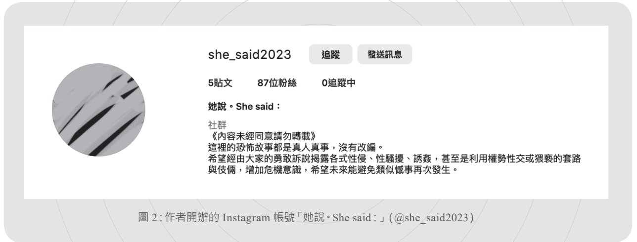
圖 2：作者開辦的 Instagram 帳號「她說。She said : 」 (@she_said2023)

五根手指數得出來的圈內人轉發。「很好呀！表示突破同溫層了」，摯友說。約莫兩週後，MeToo 才正式燒到電影圈。影集的推波助瀾加上臺灣人的政治狂熱，先從政治圈開始燒起來也是很合理的現象。